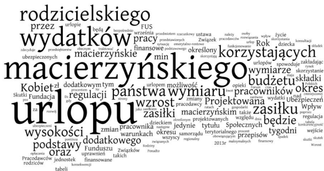
Wykres 2. Chmura słów dla tekstu OSR w projekcie ustawy o zmianie ustawy – Kodeks pracy oraz ustawy o świadczeniach pieniężnych z ubezpieczenia społecznego w razie choroby i macierzyństwa (projekt z 8 listopada 2012 r.)

rodzinę, czy też sytuację dzieci, a przecież regulacja te będzie na rodzinę i dzieci oddziaływała w sposób bezpośredni i zdecydowany. W teście OSR praktycznie nie występują słowa ‘dziecko’ i ‘rodzina’. Dobitnie pokazuje to tzw. chmura słów dla tego korpusu tekstu – im dane słowo częściej występuje, tym na poniższym rysunku jest większe (zob. Wykres 2).